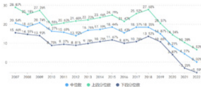
LP投顾2023业绩基准-人民币基金 GROSS IRR (基金数2339)